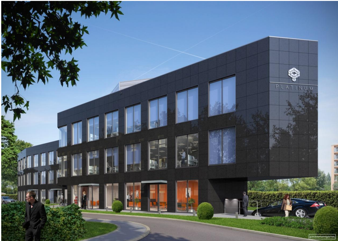
PLATINUM - widok z ul. Kordylewskiego