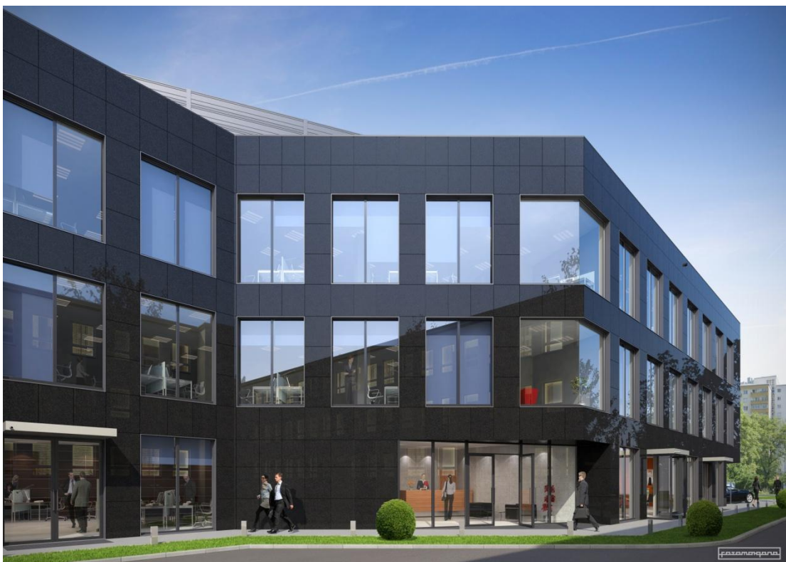
PLATINUM – wejście do budynku